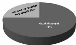
Selection abszolút hozam eszközalap

1: nem jellemző/nagyon alacsony, 2: alacsony, 3: közepes 4: magas, 5: nagyon magas