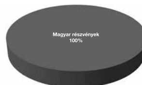
Magyar részvény eszközalap

1: nem jellemző/nagyon alacsony, 2: alacsony, 3: közepes 4: magas, 5: nagyon magas