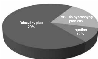
TrendMax árfolyamvédett eszközalap

1: nem jellemző/nagyon alacsony, 2: alacsony, 3: közepes 4: magas, 5: nagyon magas * Futamidő alatt 5, lejáratkor 1