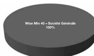
ÁrfolyamFix 2019 árfolyamvédett eszközalap

A tortadiagramok szemléltetés céljából készültek, az eszközalapok aktuális összetétele a diagramon feltüntetett értékektől eltérhet!