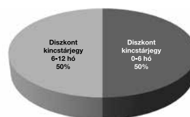
Pénzpiaci 2011 árfolyamvédett eszközalap

1: nem jellemző/nagyon alacsony, 2: alacsony, 3: közepes 4: magas, 5: nagyon magas