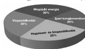
New Energy abszolút hozam eszközalap

1: nem jellemző/nagyon alacsony, 2: alacsony, 3: közepes 4: magas, 5: nagyon magas