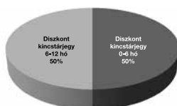
Pénzpiaci 2011 árfolyamvédelem eszközalap

1: nem jellemző/nagyon alacsony, 2: alacsony, 3: közepes 4: magas, 5: nagyon magas