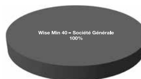
ÁrfolyamFix 2019 árfolyamvédett eszközalap

A tortadiagrammok szemléltetés céljából készültek, az eszközalapok aktuális összetétele a diagrammon feltüntetett értékektől eltérhet!