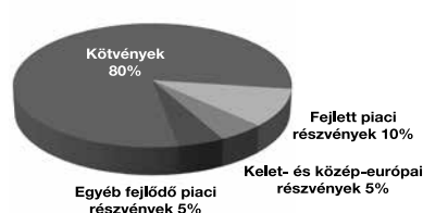
Konzervatív vegyes eszközalap

1: nem jellemző/nagyon alacsony, 2: alacsony, 3: közepes 4: magas, 5: nagyon magas