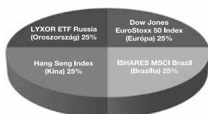
TrendMax árfolyamvédett eszközalap

1: nem jellemző/nagyon alacsony, 2: alacsony, 3: közepes 4: magas, 5: nagyon magas * Futamidő alatt 5, lejáratkor 1