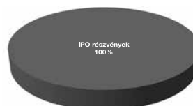
IPO abszolút hozam eszközalap

1: nem jellemző/nagyon alacsony, 2: alacsony, 3: közepes 4: magas, 5: nagyon magas